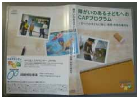
障がいのある子どもへの CAP プログラム CD カバー