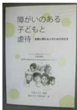
ブックレット 「障がいのある子どもと虐待」