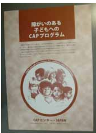
障がいのある子どもへの CAP プログラム紹介リーフレット