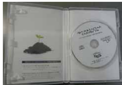
障がいのある子どもへの CAP プログラム CD