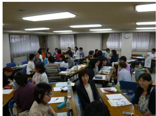
議案審議終了後の意見交換の時間