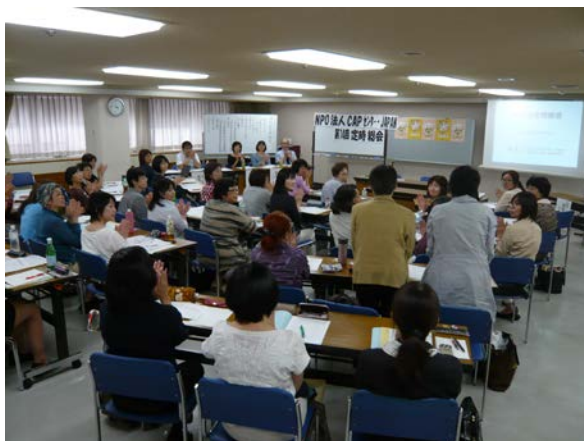
審議の前に、参加正会員のご紹介

さて、私のあいさつはここまでで、これから、総会の議事に移るにあたって、皆さんにお詫びしなくてはならないことがあります。次年度の予算について、昨日、議案書に数字の間違いがあることに気付きました。議案書は事前にお送りしており、すでに多くのグループから書面表決「承認」もいただいております。しかし、ミスのあるまま承認していただくことはできませんので、今朝、臨時理事会を開き、修正案を提出することにいたしました。この修正案を皆さんにご審議いただきたいと思っております。資料は今から配ります。詳細は、第 2 号議案のところでお伝えします。今回の件は事務局だけでなく、理事会の責任でもあります。本当に申し訳ございませんでした。後ほどの議案審議をどうぞよろしくお願いいたします。